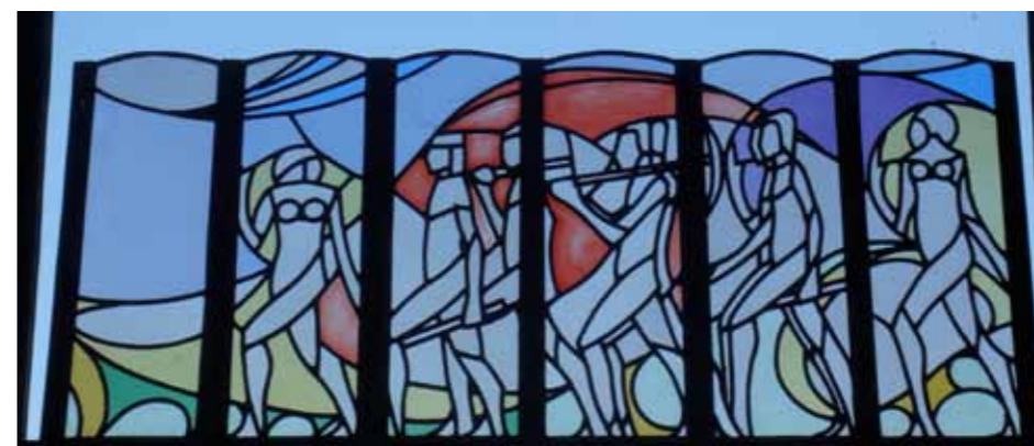
5 ————— Hildo Krop, glas-in-loodraam, datering onbekend, 40 x 110 cm, Instituut Collectie Krop, inventarisnummer D002

Het RKD gaf als reactie dat de ramen mogelijk het werk konden zijn van glaskunstenaar Toon Berg. Het hoofd van de afdeling moderne kunst schreef: 'Wij bezitten een afbeelding van een drietal glas-in-loodramen, door hem [Toon Berg, G.H.] in 1923 gemaakt voor het gymnastieklokaal van een niet bij name genoemde school in Rotterdam, waarbij de deels door elkaar lopende groep kinderen sterk doet denken aan de mannen op uw tweede raam. Op een ander gebrandschilderd raam van 1928, in een trappenhuis van een school in Dordrecht, komen de ronde vormen voor die ook bij uw ramen opvallend aanwezig zijn'. 2 Naar welke afbeelding uit het RKD archief precies verwezen werd is