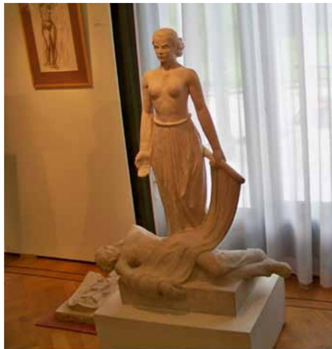
3 ————— Impressie 2009 Instituut Collectie Krop, Steenwijk

werk aan het Amsterdamse Scheepvaarthuis en ontwierp hij bouwsculpturen voor talloze gebouwen en bruggen in Amsterdam. Maar hij maakte ook ontwerpen voor boekbanden, litho's, schilderijen, houtsneden (onder meer voor het kunstmagazine Wendingen ), meubelen en modellen voor het aardewerk van de fabriek ESKAF.