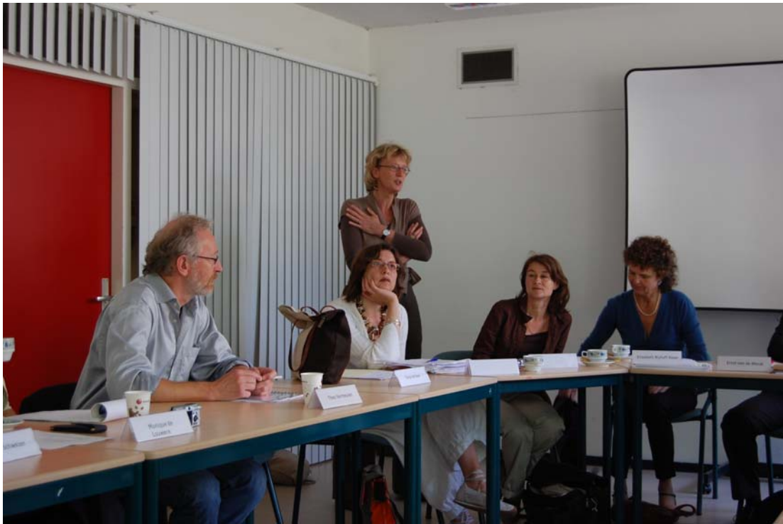
Bijeenkomst 6 juni 2008, Utrechts Archief, Thema risicomanagement