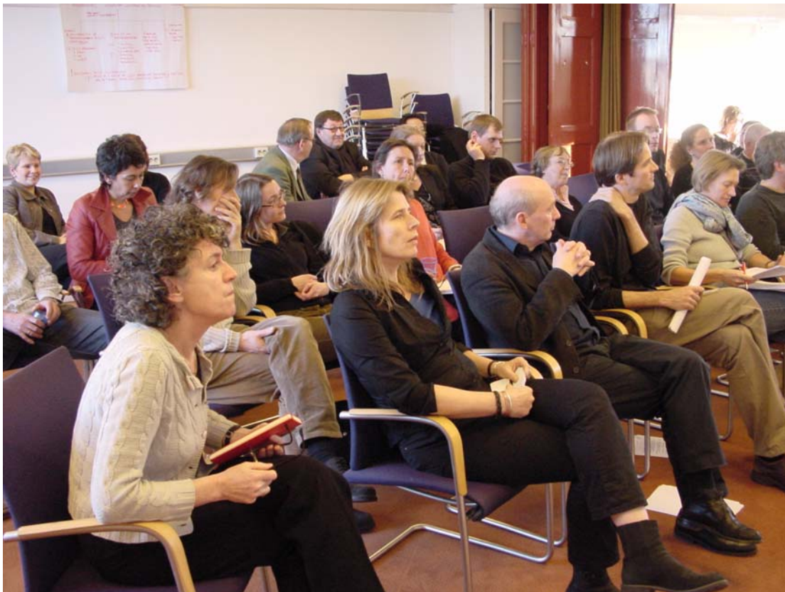
Bijeenkomst ICN medewerkers , 11 februari 2008